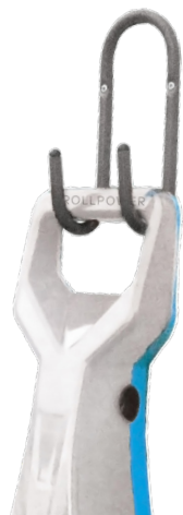
Support mural inclus